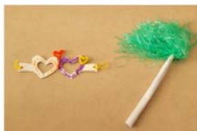
ポンポンスティック メガネ

いろいろな製作が作れます。 他にもまだまだたくさんあります。 作りたい物があったら教えてね!!