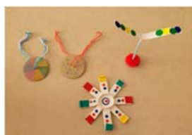
びゅんびゅんごま こま 竹トンボ

寒さが身に染みる季節となり、気温が低く乾燥した日々が続いています。この時期は体調を崩しやすく、病児保育室の利用を検討される場合もあると思います。いつもと違う場所で過ごすのは、親子ともに不安ですよね。そこで、病児保育室での1日の流れと過ごし方を紹介します。