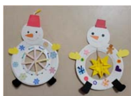
花こま(よく回るコマ) 季節の製作(雪だるま)