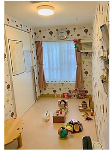
隔離室 B (4.93m 2 )