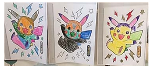
色々なピカチュウ (小1男子作)

キャラクターのぬりえをする時、見本通り同じ色で塗る子が多い中、時々自分の好きな色で自由に塗っている子もいます。そんな風に、あえて違う色で塗ってみるのも楽しいかもしれません☆