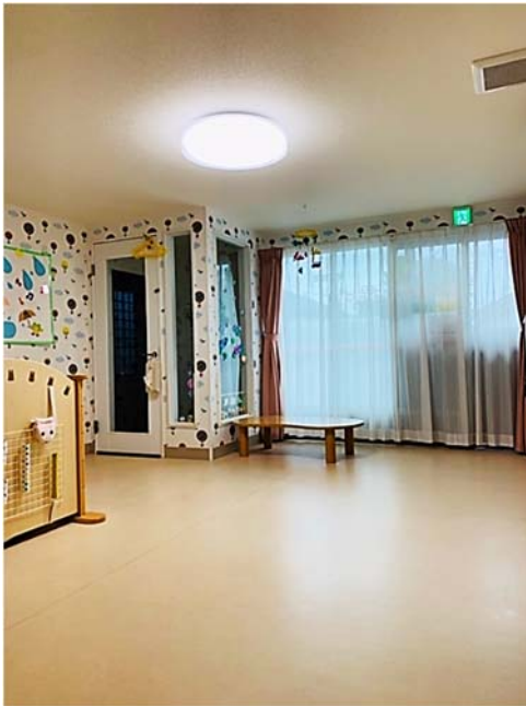
保育室 (21.77m 2 )