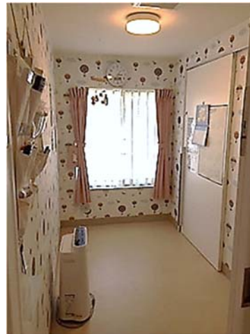
隔離室 A (4.93m 2 )